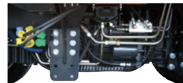
Seitliche Anbauvorrichtung und ordentlich verlegte Standard-Hydraulikleitungen

Das Multi-Konzept ermöglicht auch den Anbau eines Feuchtsalzstreuers.