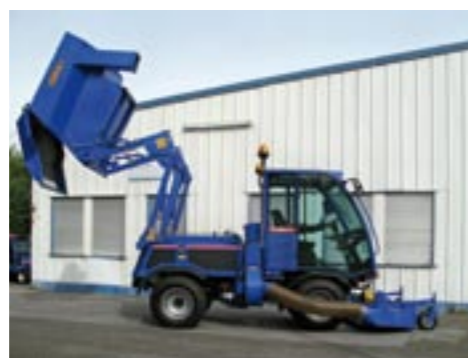
Hochentleerung von 230 cm und Überstand von 50 cm