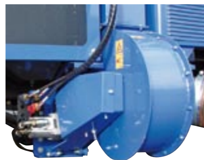
Vollhydraulischer Antrieb für die robuste Turbine