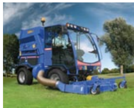
Vollhydraulische Grasaufnahme mit 1600-Liter-Sammelbehälter