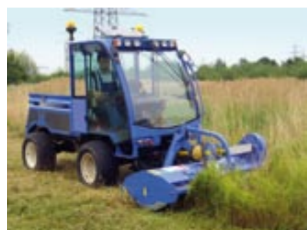
Mit dem Schlegelmäher gegen Wildwuchs