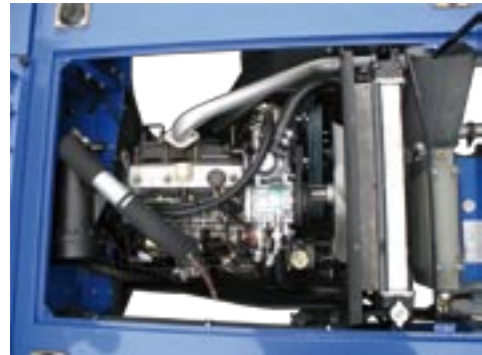
Der leistungsstarke ISEKI 4-Zylinder Dieselmotor