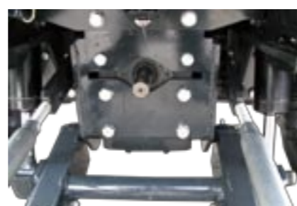
Mechanische Getriebezapfwelle vorn