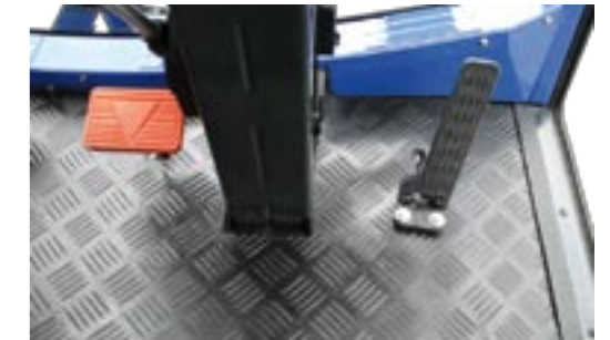
Großräumiger Fußbereich mit Fußbremse (links) und Servopedal (rechts)

Durch die ergonomische Anordnung der Bedienelemente für Hydraulik, Zapfwellen, lastschaltbarer Fahrstufe, Tempomat und Tempo-Feineinstellung sind Sie immer Herr der Lage.