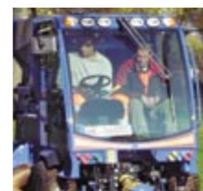
Für Fahrer und Beifahrer bietet der ICT 50 viel Platz mit 2 Komfort-Sitzplätzen.

Mit dem ICT 50 arbeiten Sie wirtschaftlich und rationell – 12 Monate und wenn es sein muss 365 Tage im Jahr. ISEKI bietet Ihnen dazu die komplette Palette von Anbaugeräten aus eigener Herstellung. Das ist unser Verständnis von Systemlösungen!