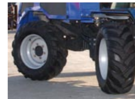
Trelleborgbereifung: 1540 mm Außenbreite