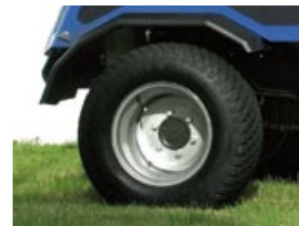
Universal-Rasenbereifung: 1600 mm Außenbreite