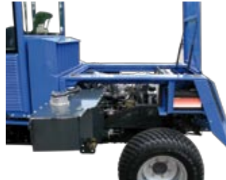
Die beiden Tanks für Kraftstoff und Öl werden zum leichteren Wartungszugang einfach nach außen geschwenkt.