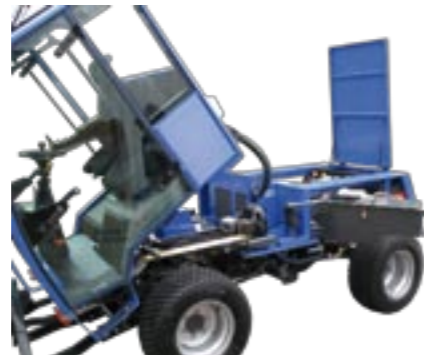
Note 1 in punkto Wartungszugang