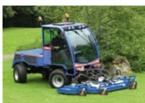
Großflächensichelmäher für rasante Rasenpflege