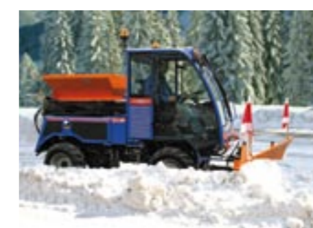
Keil-, Kombi- oder Standard-schneeräumschild