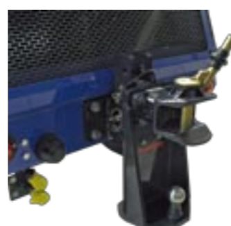
Zugmaul für ISEKI-Anhänger mit 2 Tonnen Nutzlast

Für schwere Frontanbaugeräte ist der ICT 50 serienmäßig mit mechanischer Getriebezapfwelle vorn ausgestattet. Durch die formschlüssige Kraftübertragung werden hohe Drehmomente erreicht. Die Zuschaltung erfolgt per Knopfdruck und ist natürlich unter Last möglich. Für aufgesattelte, vorn, seitlich oder am Heck angebaute Geräte steht zusätzlich eine leistungsstarke Ölhydraulik mit 65 l/min zur Verfügung.