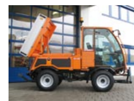
Transportgenie mit hydraulisch kippbarer Ladepritsche