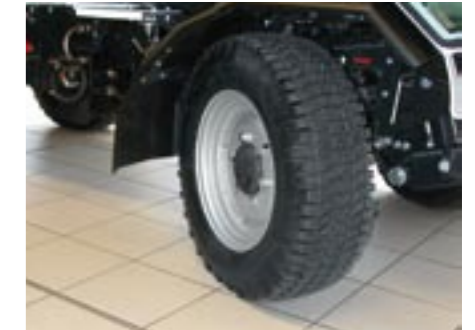
Schmale Straßenbereifung: 1410 mm Außenbreite